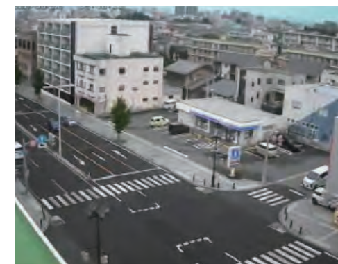
▲山形市あこや町交差点

〒990-0025 山形市あこや町1-2-4 「ダイバーシティメディア宿泊券プレゼント係」まで 応募締切 5/31(金)消印有効